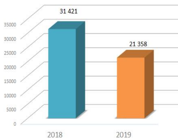
Número de processos recebidos

O setor mais reclamado em 2019 foi o elétrico (65%), com 13 156 reclamações e 722 pedidos de informação, que resulta de um universo de cerca de 6,2 milhões de consumidores.